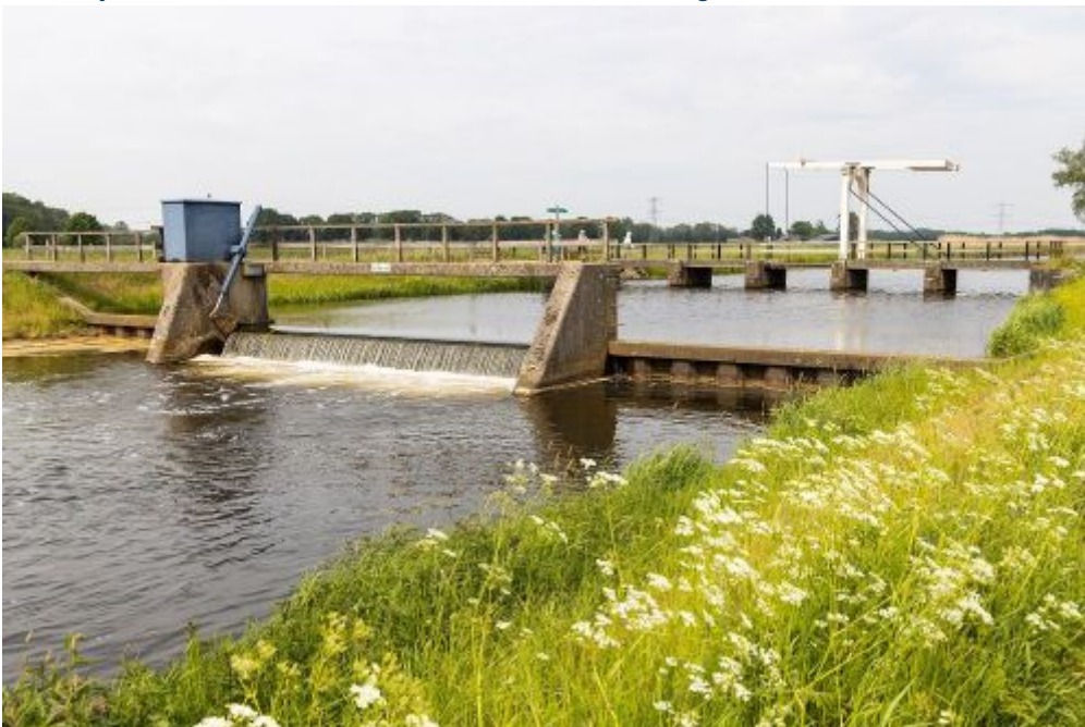
Stuw en brug Velhorst

Ynte Bekema, omgevingsmanager van Waterschap Rijn en IJssel: 'Ter hoogte van Landgoed Velhorst komen veel dingen samen. Een brug, een stuw, recreatie- en onderhoudsroutes, een vispassage en natuurlijk de cultuurhistorische waarde van het landgoed zelf.'