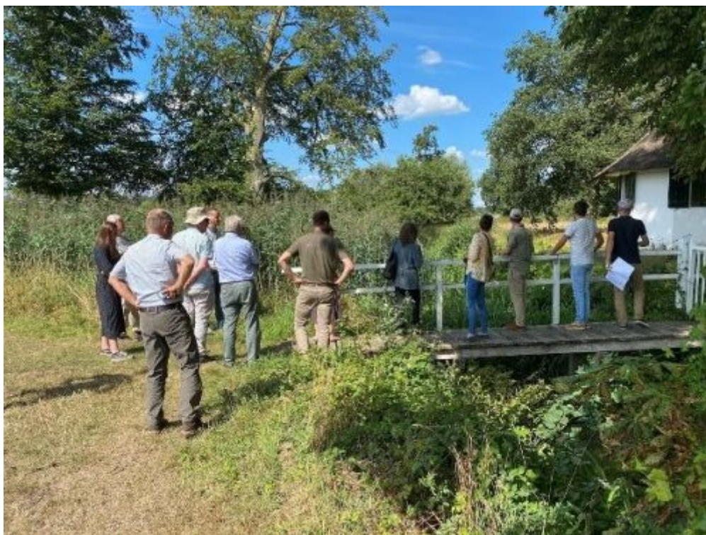
Bezoek van Rijksdienst voor Cultureel Erfgoed en Natuurmonumenten op Velhorst

Natuurmonumenten en Waterschap Rijn en IJssel de keus gemaakt het schetsontwerp aan te passen en komt er geen meanderende Berkel over het landgoed. Deze keuze is met name gebaseerd op de meerwaarde van huidige ecologische en geomorfologische waarden. Dit betekent dat de Berkel ter hoogte van De Velhorst binnen het huidige profiel blijft liggen. De bypass over het landgoed blijft ongewijzigd en behoudt zijn ecologische waarde. Wel wordt er in combinatie met de stuw een vispassage aangelegd.'